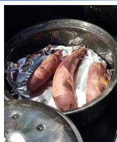
オーブンの中は冬でも140℃程に加熱され、40分でホクホクの甘いお芋が焼き上がります。

太陽の熱を集めてオーブン料理が出来る太陽光クッキング。はなさかでは災害時にも活躍する自然のエネルギー資源を利用した設備を取り入れています。