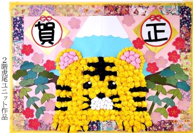
2階虎尾ユニット作品

新年あけましておめでとうございます。本年も何卒よろしくお願ひ申し上げます。 コロナ禍での2度目の新年を迎えました。新たな変異株が広がりを見せており、気を緩めることはできません。そんな中でもご利用者様の生活に楽しみを持って頂けるよう工夫をして参ります。一時再開したご面会も再び停止しておりますが、本年は1階に面会室を新設してご家族様とのふれあいを深めて頂けるように準備しています。(R4年3月使用開始予定) 工事中はご迷惑をお掛け致します。