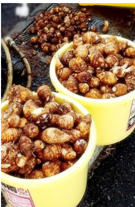
里芋は毎年栽培していて、はなさか野菜の定番です。