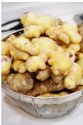
大きくて香りの強い良い品質の物が出来ました。

さつま芋が終わり早生と大玉の2種類のタマネギの苗を植えました。収穫の早いものは5月に収穫の予定で皆様のお食事で提供致します。今シーズンは生姜とヤーコンを栽培しました。生姜は出来が良いのでこの春には本格的に生産します。里芋は安定した収穫があり、煮物や味噌汁などで楽しんで頂いています。