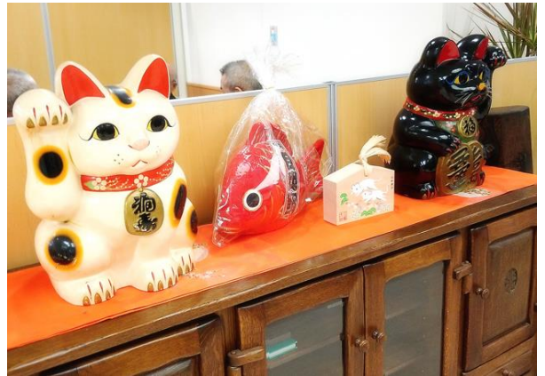
招き猫の右手は金運、左手は人を招く。黒の招き猫は厄除けと云われています。三島大社の「目出鯛」はお正月の縁起物。