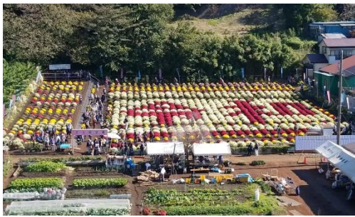
「新磯ざる菊愛好会」の皆さんが丹精込めて育てた千三百株余りの菊の花で、毎回違う模様を描いています。今年は新年号を記念して「令和」です。

はなさかの向かい側で、毎年十一月に開催される「新磯ざる菊まつり」。市内外からたくさんの方が観覧に訪れる秋のイベントです。ご利用者様も職員と一緒に、徒歩や車いすで菊の花を楽しんでいます。